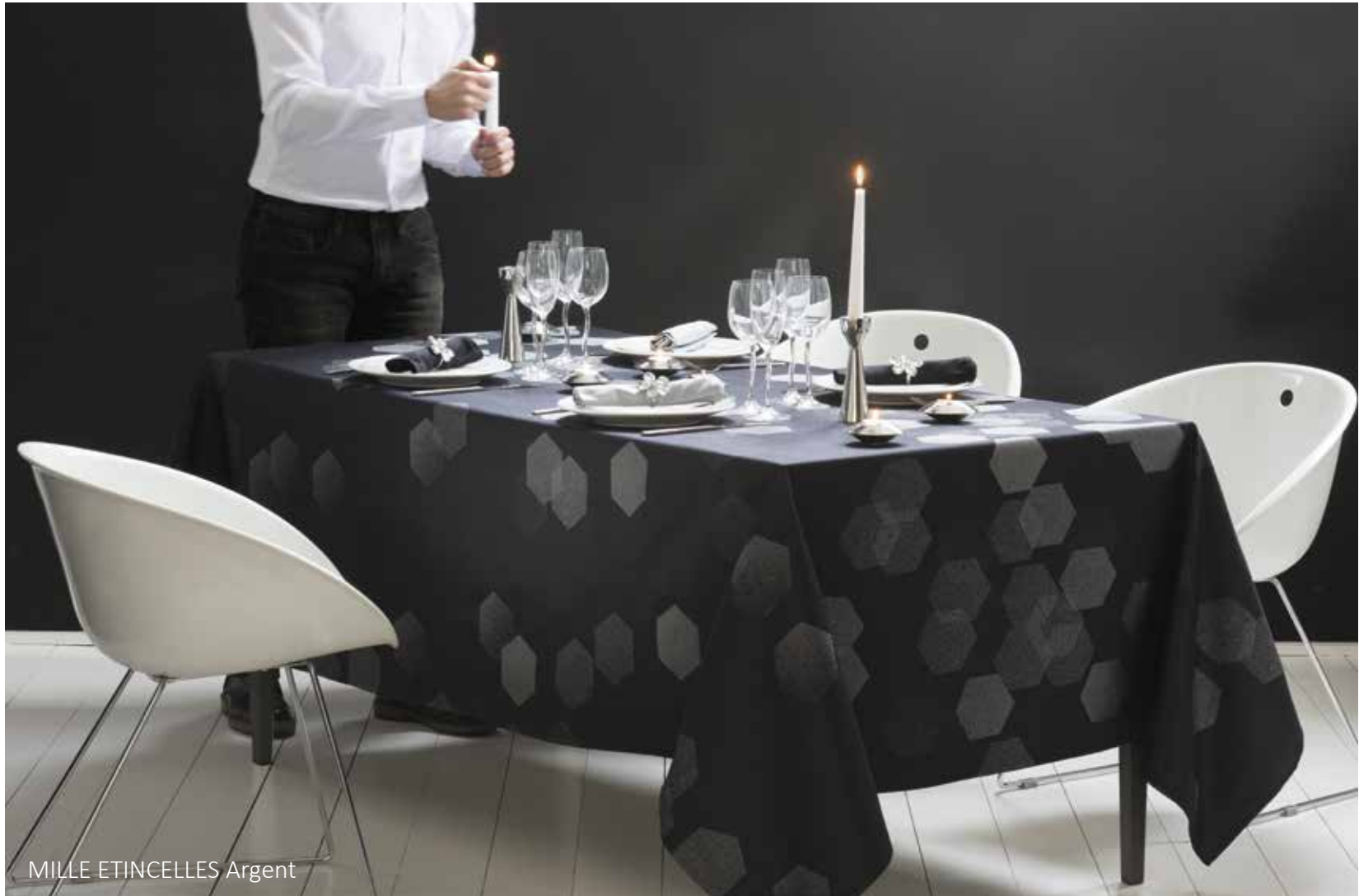
MILLE ETINCELLES Argent