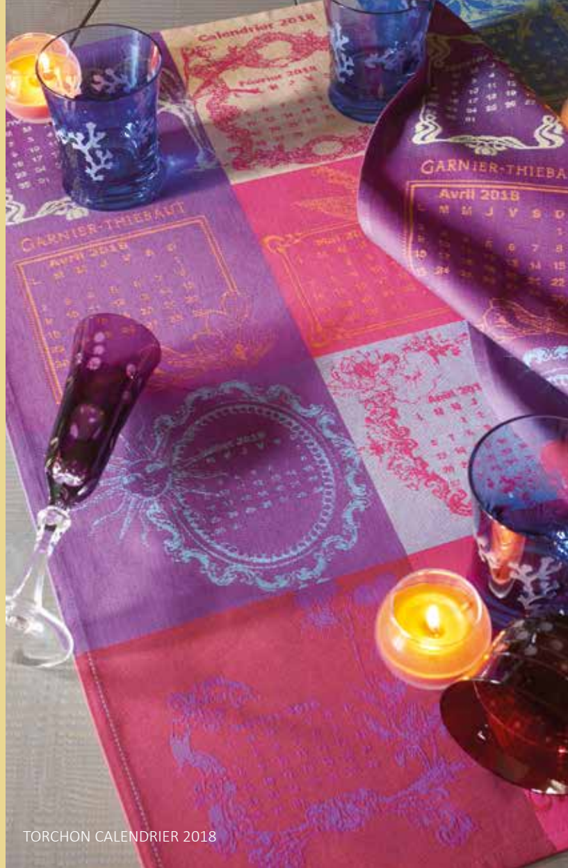
TORCHON CALENDRIER 2018

Remerciements : Porcelaines Pillivuyt, Porcelaines Raynaud Limoges, Cristallerie de Montbronn. Stylisme photos : François Delclaux