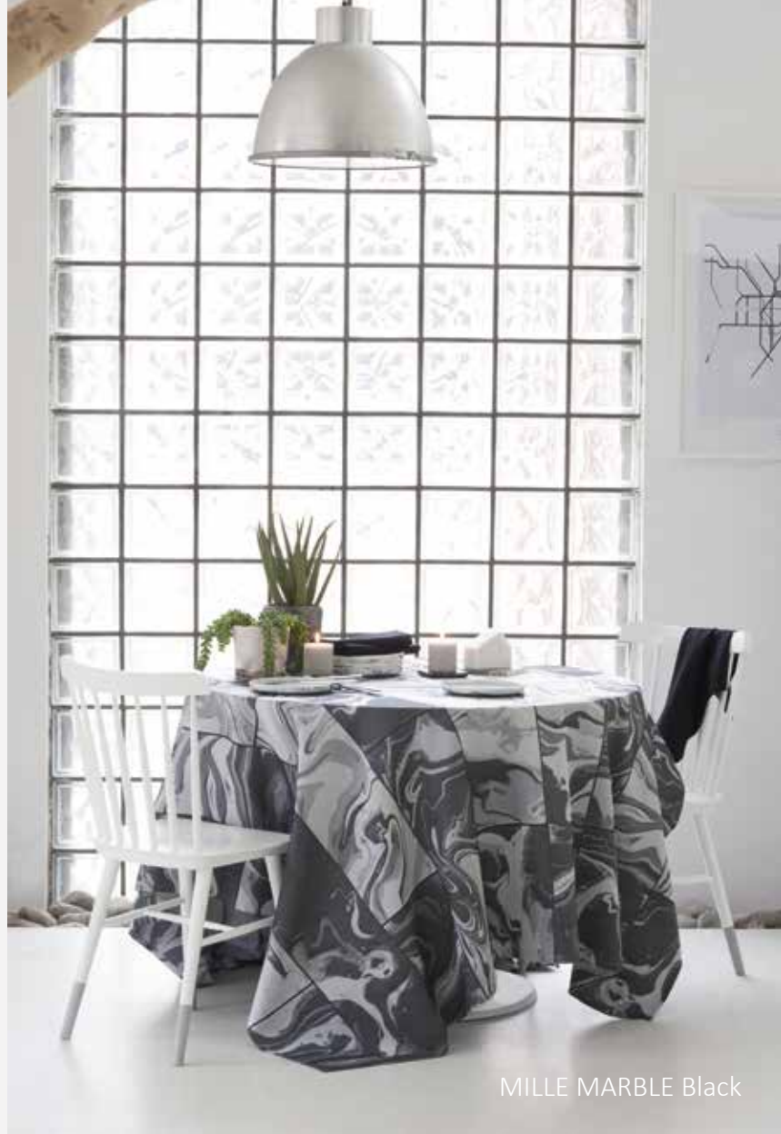
MILLE MARBLE Black