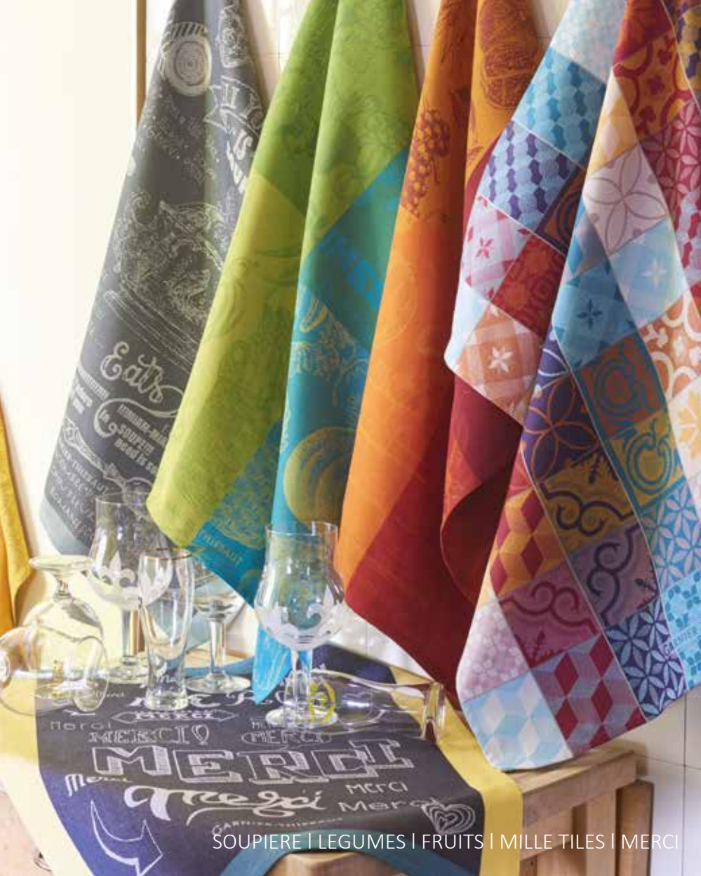
SOUPIERE | LEGUMES | FRUITS | MILLE TILES | MERCI