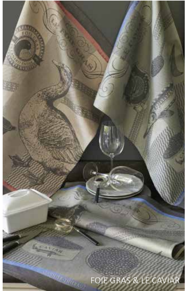
FOIE GRAS & LE CAVIAR