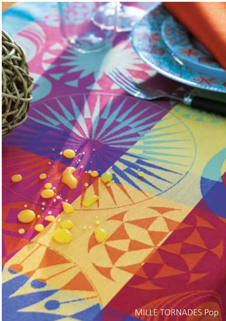
MILLE TORNADES Pop