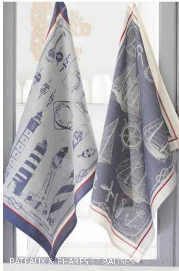
BATEAUX & PHARES ET BALISES