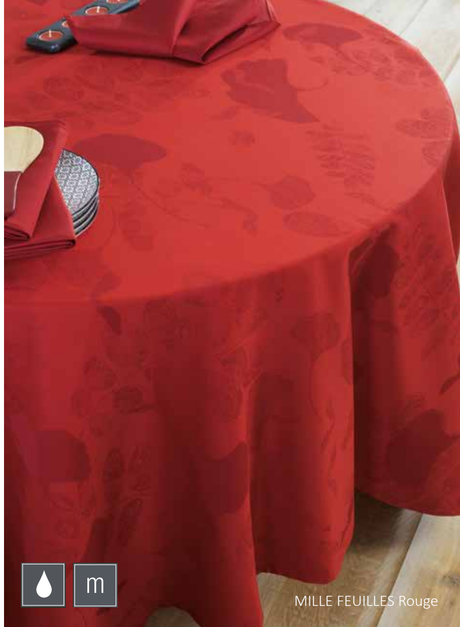
MILLE FEUILLES Rouge